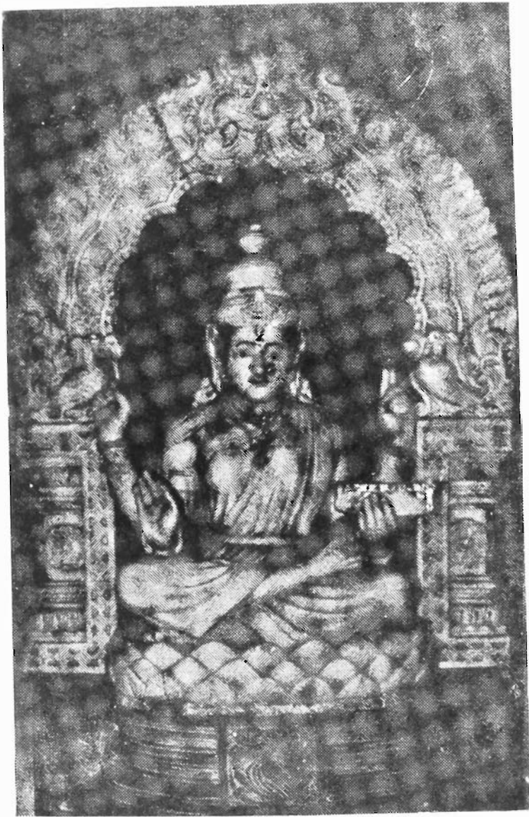
ಸರಸತಿಯ ಸತ್ರ, ಬಳಿಯಿರ (೧೨೬)